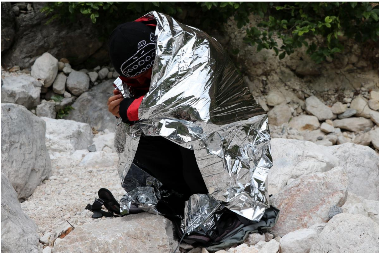
Qendrimi i trupit më i mirë në mal në rrast të stuhisë të papritur

FSAM në bashkpunim me PZS, qërshor 2018.